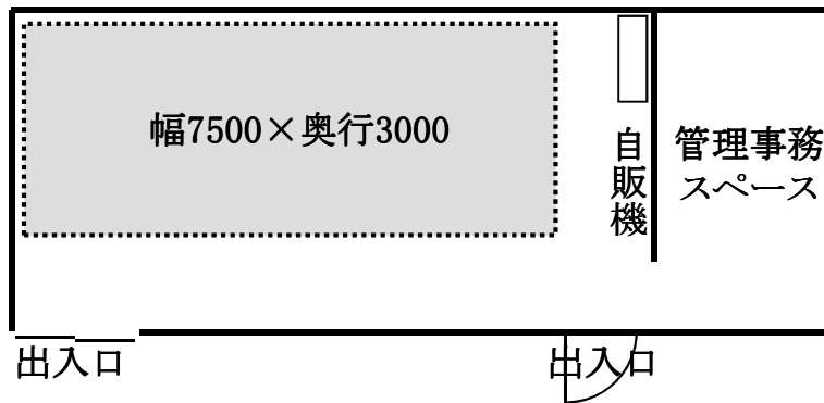
SBC長野中央ハウジングパーク・情報センター