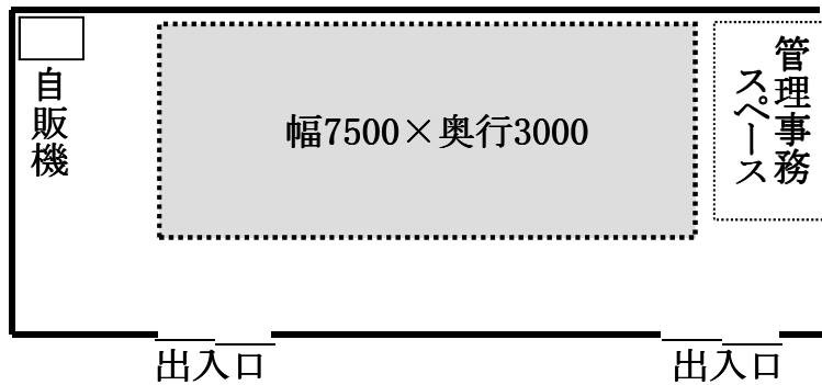
SBC長野南ハウジングパーク・情報センター